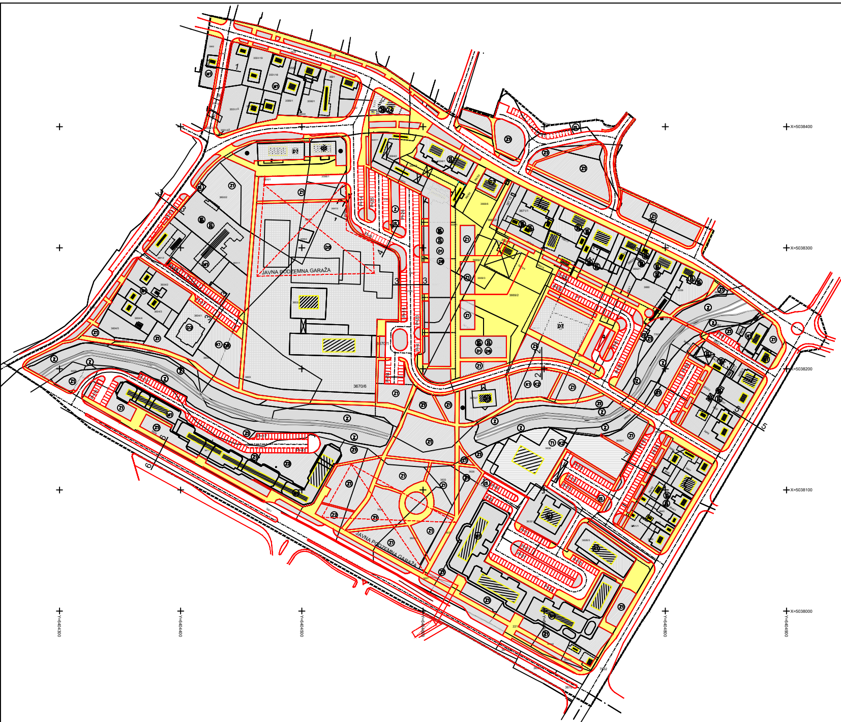
KARAKTERISTIČNI POPREČNI PROFILI PROMETNE MREŽE 1:200