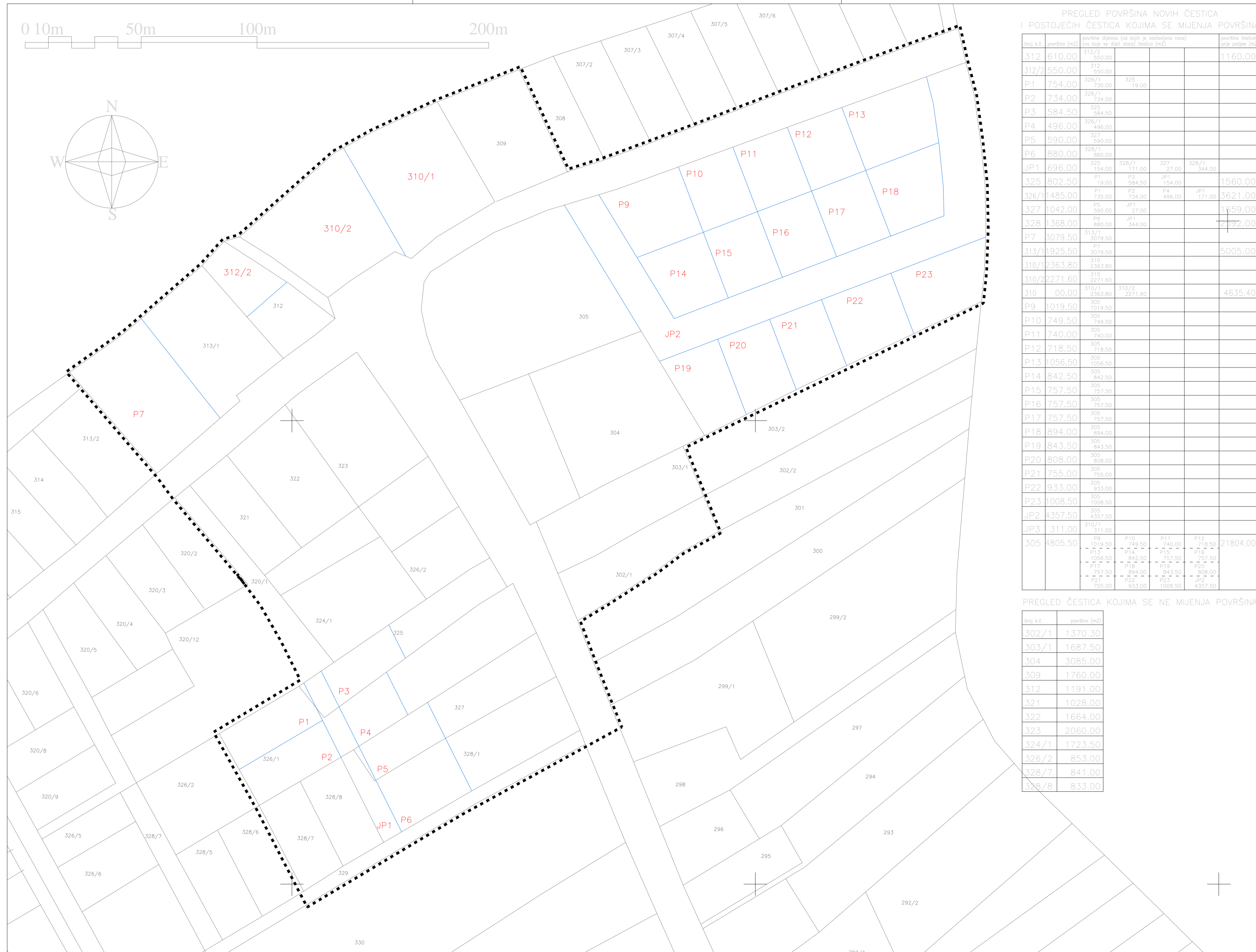
PREGLED POVRŠINA NOVIH ČESTICA I POSTOJEĆIH ČESTICA KOJIMA SE MIJENJA POVRŠINA