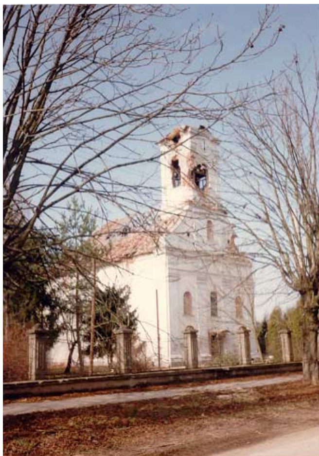
Oštećena crkva sv. Marije Magdalene u Sunji