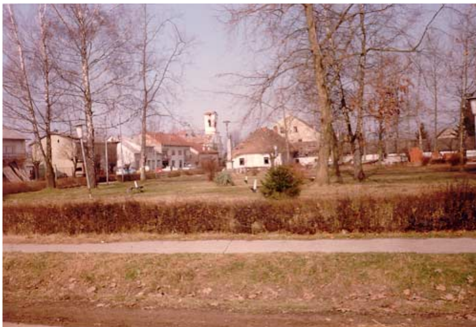
Sunja - Trg kralja Tomislava

Za potrebe PPUO Sunja korišteni su podaci iz knjige POPIS STANOVNIŠTVA, KUĆANSTAVA I STANOVA 31.OŽUJKA 2001. GODINE –Zagreb, svibanj 2001., izdavač Državni zavod za statistiku).