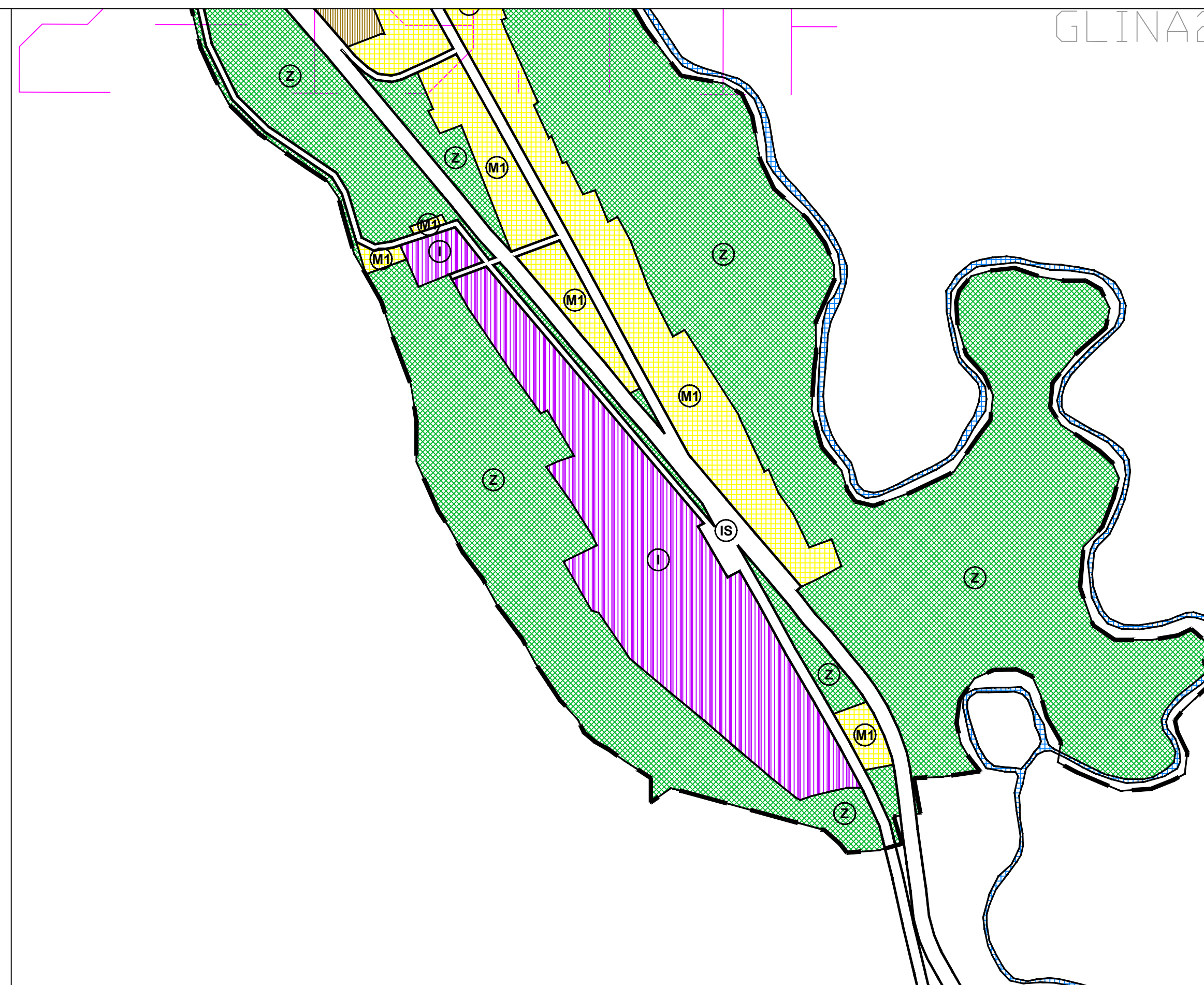
IZVORNI PLAN U MJERILU 1:5.000